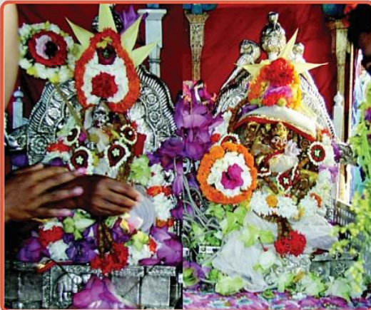
ଦକ୍ଷିଣ ଘରକୁ ବିଜେ କରନ୍ତି । ଶ୍ରୀଦେବୀ ଓ ଭୂଦେବୀ ରତ୍ନସିଂହାସନରେ ରହନ୍ତି ।

ରହେ । ଉଆଁସରୁ ରାଣୀ ଓ ରାଜ ପରିବାରବର୍ଗ ଆସି ବରକନ୍ୟାଙ୍କୁ ବନ୍ଦାପନା କରି ବିଧି ଅନୁସାରେ ଭେଟି ଦିଅନ୍ତି । ଶ୍ରୀନଅରର ନୀତି ସାରି ବରକନ୍ୟା ଶ୍ରୀମଦନମୋହନ ଓ ଶ୍ରୀଦେବୀ ପାଲିଙ୍କିରେ ବିଜେ ହୋଇ ବାଲିସାହି ଦେଇ ଶ୍ରୀମଦେଶ୍ଵର ମହାଦେବଙ୍କ ମନ୍ଦିରକୁ ଯା'ନ୍ତି । ସେଠାରେ ଠାକୁରଠାକୁରାଣୀଙ୍କର ପଞ୍ଚଗ୍ରାସୀ ନୀତି ଅନୁଷ୍ଠିତ ହୁଏ । ବନ୍ଦାପନା ପରେ ବରକନ୍ୟା ଶ୍ରୀମନ୍ଦିରକୁ ବାହୁଡ଼ା ବିଜେ କରିଥାଆନ୍ତି । ଜ୍ୟେଷ୍ଠ ଶୁକ୍ଳ ତ୍ରୟୋଦଶୀ ଦିନ ଦଇତାପତିମାନେ ଶ୍ରୀମନ୍ଦିରରେ ପ୍ରବେଶ କରନ୍ତି । ଏହି ଦିନ ରାତ୍ରିରେ ବଡ଼ସିଂହାର ସରିବା ପରେ ବରକନ୍ୟା ଦକ୍ଷିଣ ଘରକୁ ବିଜେ କରନ୍ତି । ଜ୍ୟେଷ୍ଠ ଶୁକ୍ଳ ଚତୁର୍ଦ୍ଦଶୀ ଦିନ ସନ୍ଧ୍ୟାଧୂପ ସରିବା ପରେ ଦକ୍ଷିଣ ଘରଠାରେ ପୂଜାପଞ୍ଚା, ପତିମହାପାତ୍ର, ମୁଦିରସ୍ତ ଆଇ ବରକନ୍ୟାଙ୍କର ଚତୁର୍ଥୀ ହୋମ କରନ୍ତି । ରଥଯାତ୍ରା ସାରି ନୀଳାଦ୍ରିବିଜେ ଦିନ ରାତ୍ରିରେ ଜୟବିଜୟ ଦ୍ଵାର ନିକଟରେ ବଚନିକା ପରେ ଦ୍ଵାର ପିଟିଲେ ଶ୍ରୀଜଗନ୍ନାଥ ମହାପ୍ରଭୁ ଭିତରକୁ ଯାଇ ଭଣ୍ଡାରଦ୍ଵାର ଠାରେ ବିଜେ କରିଥିବା ଶ୍ରୀଦେବୀଙ୍କ ପାଖରେ ପହଞ୍ଚିଲେ ରୁକ୍ମିଣୀ ବିବାହର ଗଢ଼ଠାଳ ଭିତରକୁ ମହାପାତ୍ର ଫିଟାଇଥାଆନ୍ତି । ବନ୍ଦାପନା ଓ ଭୋଗ ବଢ଼ିବା ପରେ ମହାପ୍ରଭୁ ରତ୍ନସିଂହାସନକୁ ବିଜେ କରନ୍ତି । ଏହିପରି ଭାବରେ ମହାପ୍ରଭୁଙ୍କର ରୁକ୍ମିଣୀହରଣ ଲୀଳା ଶ୍ରୀମନ୍ଦିରରେ ମହାସମାରୋହରେ ପାଳିତ ହୋଇଥାଏ । ମହାପ୍ରଭୁଙ୍କର ଏହି ଅନନ୍ୟ ଲୀଳାକୁ ଯେଉଁ ଭକ୍ତଗଣ ସ୍ଵଚକ୍ଷୁରେ ଦର୍ଶନ କରନ୍ତି, ତାଙ୍କର ମାନବ ଜନ୍ମ ଧାରଣ ସାର୍ଥକ ହୋଇଥାଏ ବୋଲି ବିଶ୍ଵାସ ରହିଛି ।